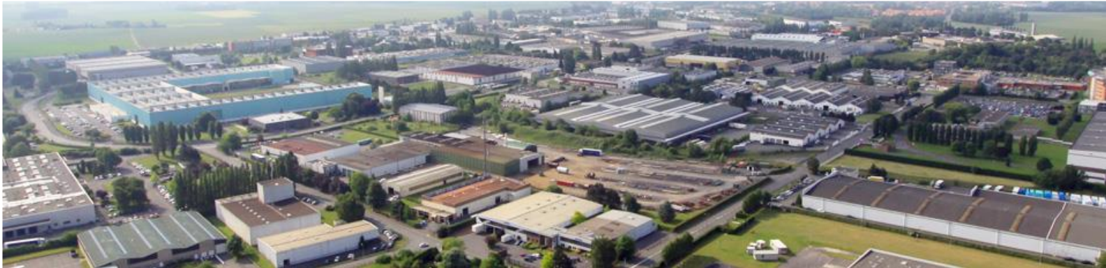
Lille – Zone industrielle de Seclin