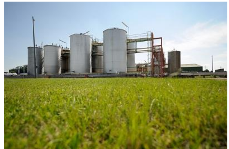
Lyon – Parc d'activités de la Plaine de l'Ain, Saint-Vulbas