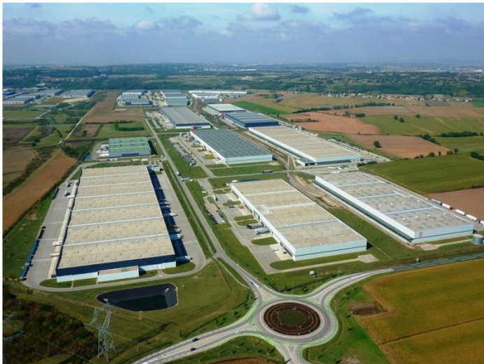
Lyon – Parc d'activités de Chesne, Saint-Quentin-Fallavier